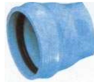
Campana integral al tubo